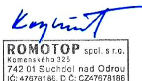
Ing. Vladimír Krajíček Product und -Innovationleiter

Bitte lesen und befolgen Sie die Aufstell- und Bedienungsanleitung! Abstände zu brennbaren Bauteilen sowie Brandschutz müssen eingehalten werden! Der Feuerstätte muss ausreichend Verbrennungsluft zuströmen können! Heizgeräte mit Wassertechnik dürfen nur in Betrieb genommen werden, wenn alle Sicherheitseinrichtungen betriebsbereit und funktionsfähig sind!